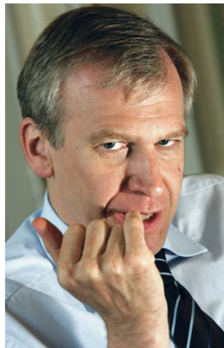
Yves Leterme heeft deze week weinig vrienden gemaakt.

In De Handelingen blikt de redactie terug op de politieke actualiteit van de week